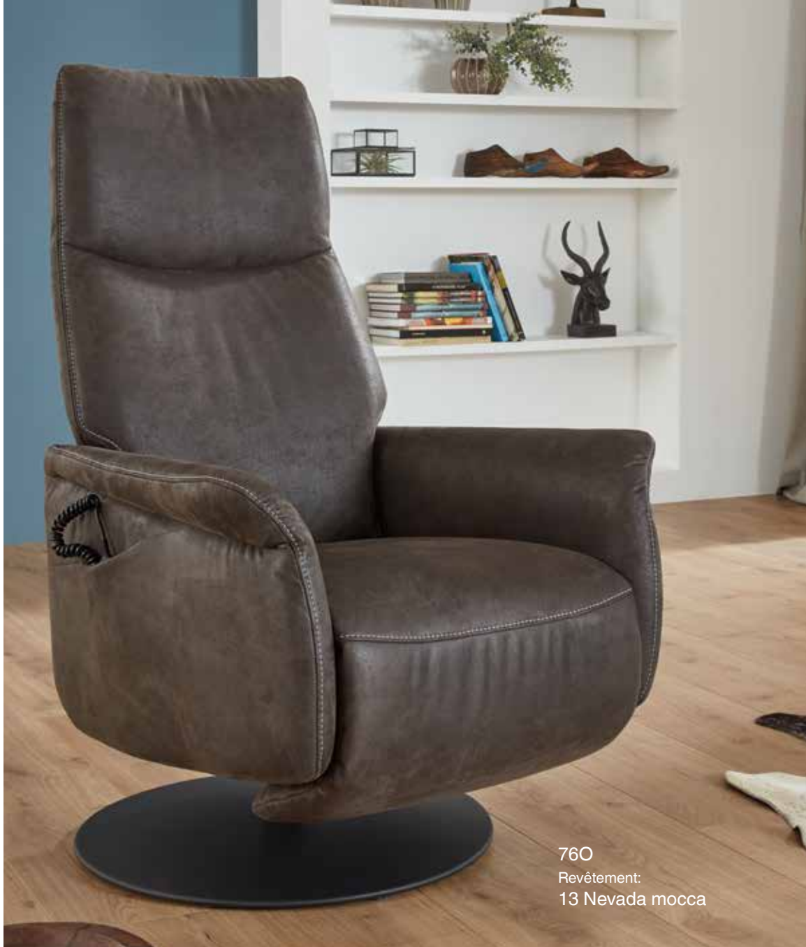
760 Revêtement: 13 Nevada mocca