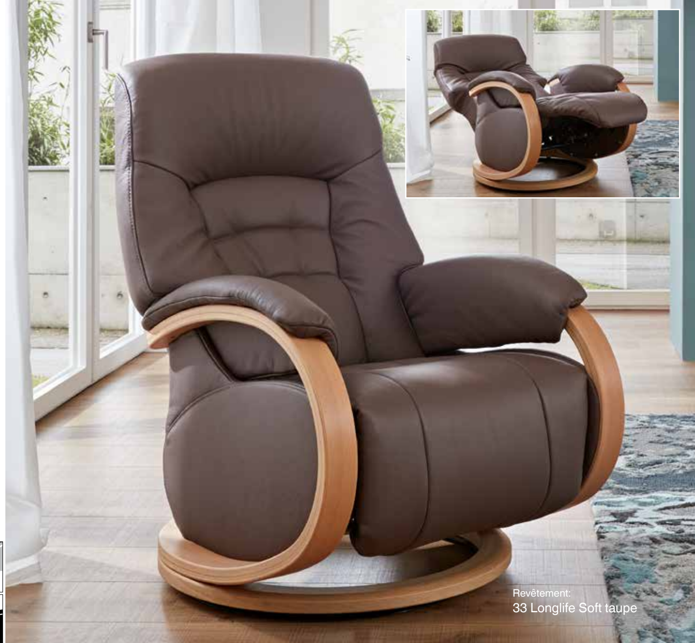
Revêtement: 33 Longlife Soft taupe