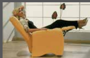
réglage électrique indépendant du dossier et repose-pieds avec ou sans batterie externe

réglage du repose-pieds par pression corporelle, réglage du dossier sans cran à l'aide de la dragonne placée entre assise et accoudoir.