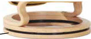
cercle de surélévement