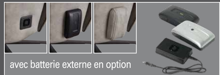
avec batterie externe en option

réglage électrique indépendant du dossier et repose-pieds par moteurs