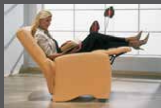
assise manuelle dossier à vérin à gaz

réglage du repose-pieds par pression corporelle, réglage du dossier sans cran à l'aide de la dragonne placée entre assise et accoudoir.