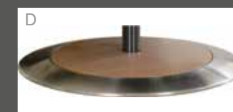
bois serti inox