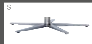
ped étoile chromé