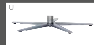
ped étoile acier