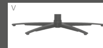
ped étoile recouvert par poudre anthracite