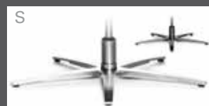
Metall-Sternfuß schmal - verchromt - Edelstahloptik - Anthrazit (pulverbeschichtet)