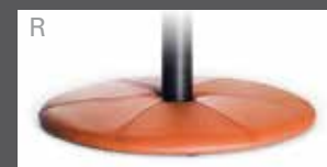
Bezogener Teller (Leder oder Stoff)