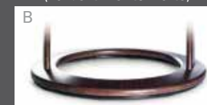
Holzdrehring in Buche (Farbe lt. Beiztonkarte)