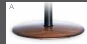
Holzteller in Buche (Farbe lt. Beiztonkarte)