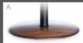
A Holzsteller in Buche (Farbe lt. Beiztonkarte)