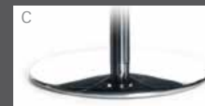
C Metallteller Chrom