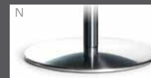
N Metallteller Edelstahloptik

Die praktische Aufstehhilfe ist ein ideales Hilfsmittel zur Steigerung der Lebensqualität für Menschen mit eingeschränkter Bewegungsfähigkeit.