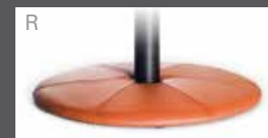
R Bezogener Teller (Leder oder Stoff)