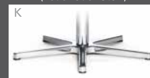
K Sternfuß Chrom