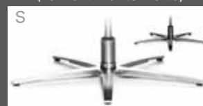
S Metall-Sternfuß schmal - verchromt - Edelstahloptik - Anthrazit (pulverbeschichtet)