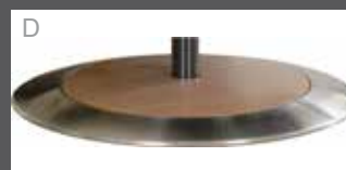
Holz mit Edelstahlring