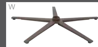
Sternfuß Bronze pulverbeschichtet