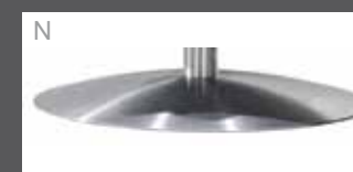
Socle rond acier brossé