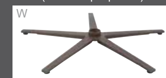
Pied étoilé bronze (recouvert par poudre)