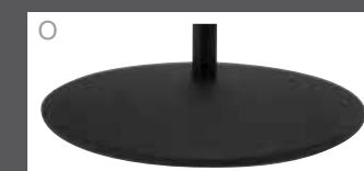
Socle rond anthracite (recouvert par poudre)