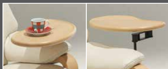
Table pivotante adaptée