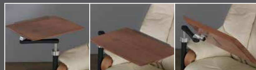
Table Laptop adaptée