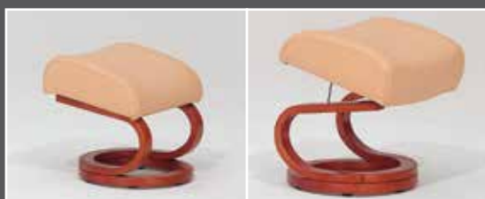
Pouf réglable en hauteur

La tête s'adapte individuellement à votre position d'assise ou de relaxation