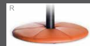
Bezogener Teller (Leder oder Stoff)