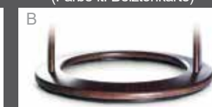
Holzdrehring in Buche (Farbe lt. Beiztonkarte)