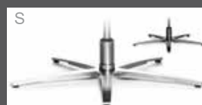
Metall-Sternfuß schmal - verchromt - Edelstahloptik - Anthrazit (pulverbeschichtet)