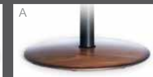
Holzteller in Buche (Farbe lt. Beiztonkarte)