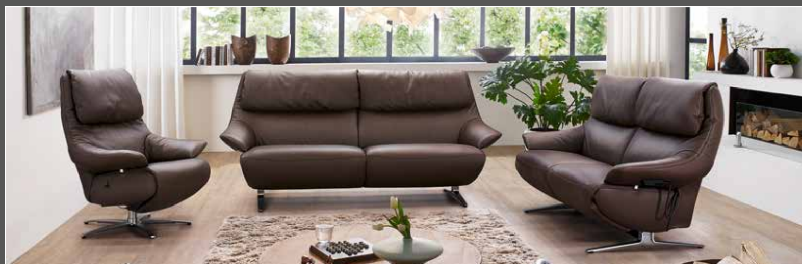
Variante 12X / 81Q mit Cosyform-Sessel 7602 in 24 Longlife Rustika erde