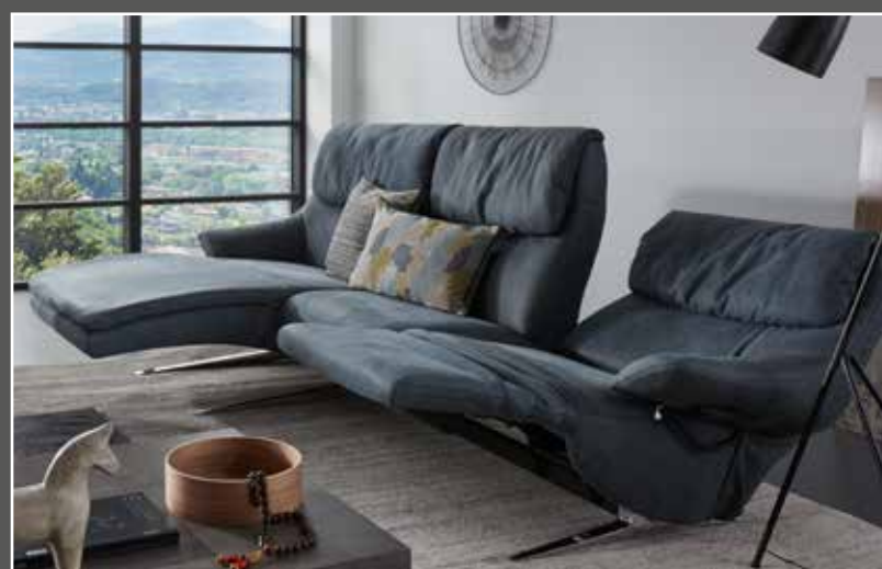
Composition 29/20 en 33 Buffalo taube réglage inclinaison d'assise - les accoudoirs suivent le dossier